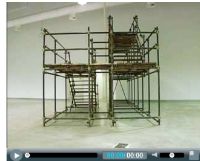
report / FRANCESCO CARONE - EX3, Firenze