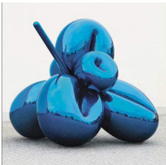
Jeff Koons , Balloon Flower (Blue)

New York | Tijdens de Post-War and Contemporary Evening Sale van Cristie's op 10 wordt Jeff Koons' blauwe Balloon Flower geveild.