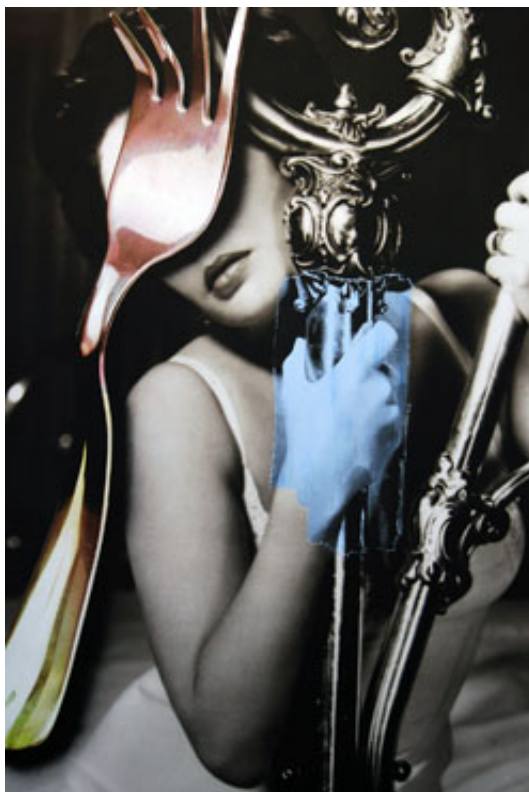
Urs Fischer @ Sadie Coles HQ

Londen | Tijdens de Frieze Art Fair valt ook bij Londense galeries veel moois te zien waard voor wie niet alleen de kunstbeurs en side fairs wil bekijken.