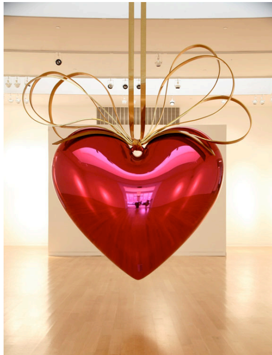
Hanging Heart (Magenta/Gold)

De Balloon Flowers maken deel uit van Koons' Celebration serie . Deze serie is geïnspireerd op verjaardagen en andere speciale gelegenheden waarbij de glimmende oppervlakten en eeuwige cyclus van geluk en optimisme suggereren. Andere belangrijke sculpturen in de serie zijn Hanging Hearts , Diamonds en Balloon Dogs .