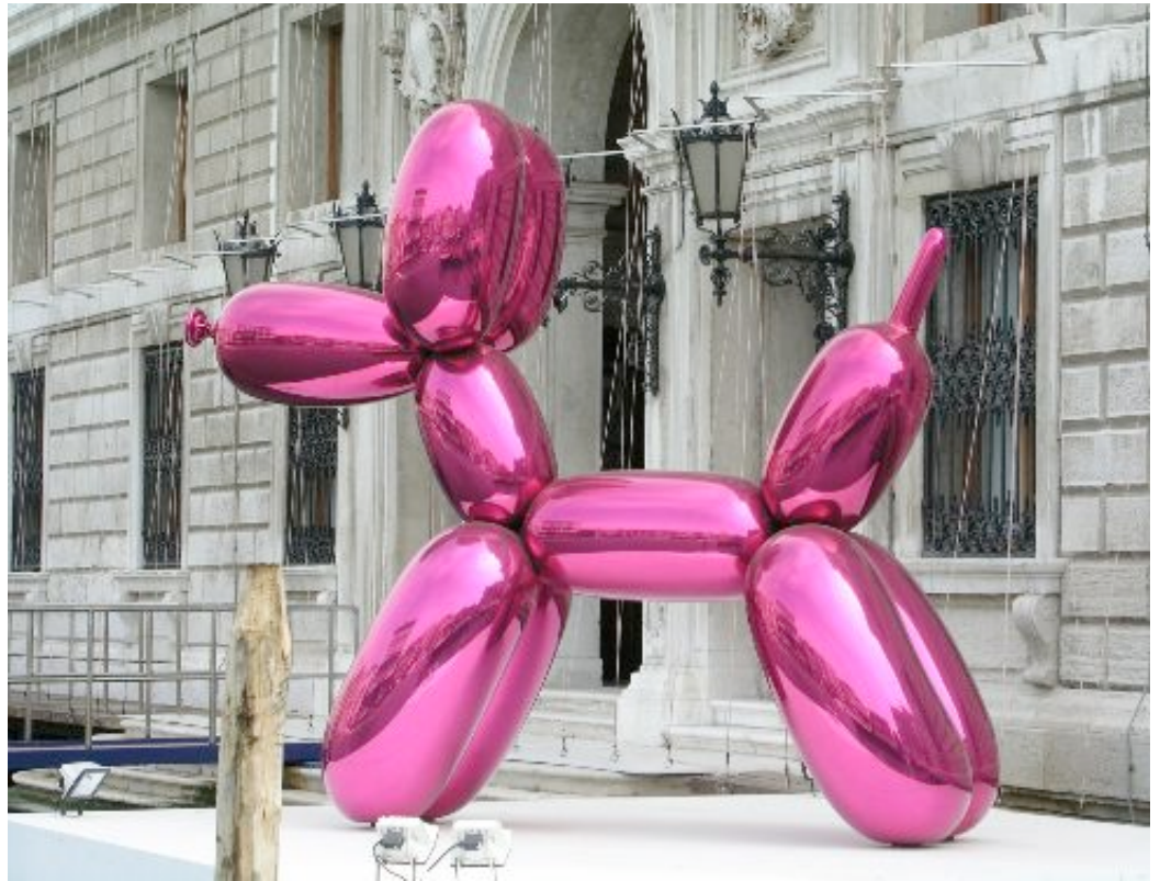
Balloon Dog (Magenta)

Het knalblauwe beeld dat zal worden geveild heeft lange tijd op de Potsdamer Platz in waarna het beeld met 30 andere werken over de hele wereld werd tentoongesteld in h educatieve programma van The Daimler Art Collection . De opbrengst van de blauw worden gebruikt om dit programma voort te zetten.